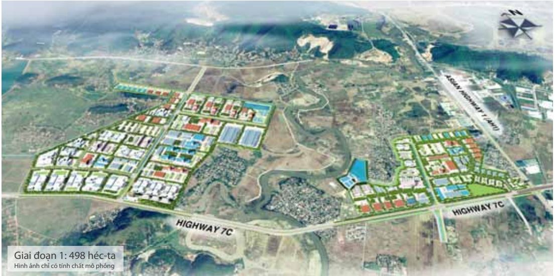
Giai đoạn 1: 498 héc-ta Hình ảnh chỉ có tính chất mô phỏng